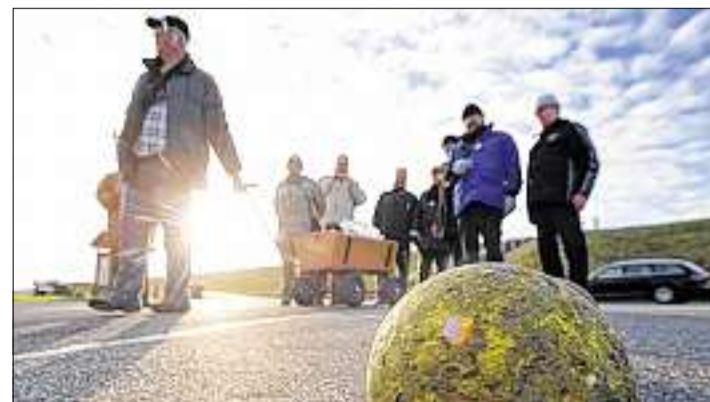
Vielen Kohlfahrern ist das Boßeln bekannt. Es muss allerdings nicht gleich eine original Boßelkugel sein – eine aus Kunststoff ist ebenso geeignet.

Die ungeschriebenen Kohlgesetze verlangen es, dass die Kohlgesellschaften bei den zwei- bis dreistündigen Wanderungen nicht einfach nur einen Fuß vor den anderen setzen dürfen. Gruppenspiele sind bei der Tour das Salz in der Suppe. Da fliegen Teebeutel und Gummistiefel durch die Luft und es werden Eier auf Löffeln balanciert. Boßeln, die friesische Art des Kegels, ist bei vielen Kohlfahrten ein Muss. Geboßelt wird in zwei Teams auf der Straße oder auf dem Wanderweg. Von einer Startlinie aus wird eine Kugel geworfen. Das Ziel liegt wenige Kilometer entfernt. Nach einem Wurf darf das nächste Teammitglied genau von dieser Stelle aus weiter werfen. Gewonnen hat das Team, dessen Kugel mit den wenigsten Würfen das Ziel erreicht hat.